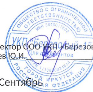
График отключения для проведения плановых работ по ВРУ Жилых домов на Сентябрь (время отключения с 10.00 до 17.00)