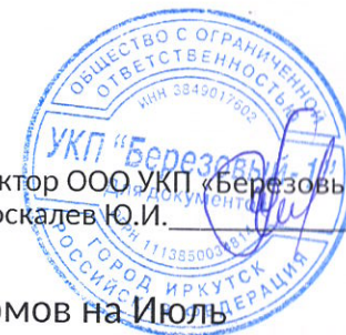
График отключения для проведения плановых работ по ВРУ Жилых домов на Июль (время отключения с 10.00 до 17.00)